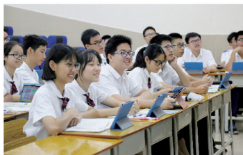
▲ 英语智慧教育课堂