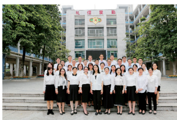
▲ 省、市级骨干教师（部分）