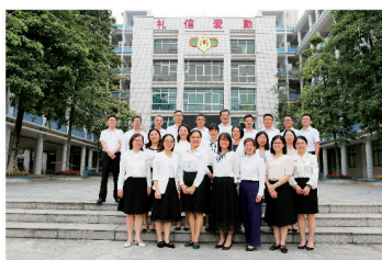
▲ 省、市级名班主任、骨干班主任、优秀班主任（部分）