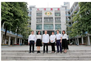
▲ “百千万”名教师培养对象（部分）

2016年起学校开始启动“教师群体卓越工程”，学校现有特级教师1人、正高级教师2人、高级教师101人，博士学位4人、硕士学位88人，广东省名校长工作室主持人1人，广州市名师工作室主持人8人，市级以上名校长、名教师、优秀教师、骨干教师、优秀班主任占全校教师比例达35%，居广州市高中前列。近年来有162人次被评为区级以上骨干教师，教师发展的成功经验多次被上级教育行政部门收集、采纳和推广报道。近5年，我校建成2个区级学科教研基地（物理、地理）、17个区级以上教师发展工作室，教师在专业期刊累计公开发表论文142篇（其中北大中文核心期刊8篇、SCI论文2篇），教师竞赛获市级以上奖励达249人次。