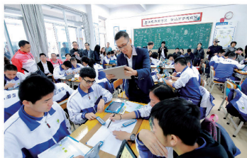
▲ 物理智慧教育课堂