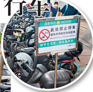
▲坑口地铁站D口人行道竖立“禁止停放”告示牌(资料图片)。