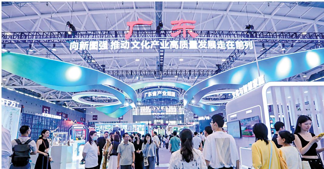
■广东展团主展厅超过50家链主企业进驻,重点打造文化与科技融合生态。