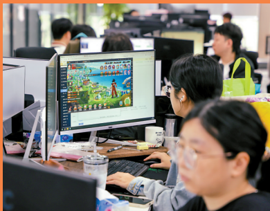
■鱼珠AI智慧港聚集了近百家游戏企业。

当下,科韵路的业务版图形成了多元化、上下游延伸的特点,这丰富了游戏整个行业的业务结构,形成了代表性的多元化数字产业生态。不少游戏企业积极拥抱人工智能、大数据和云计算等领域,成为发展的新趋势。