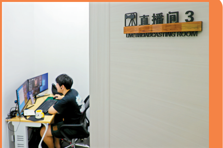
■工作人员在直播间里讲解游戏。