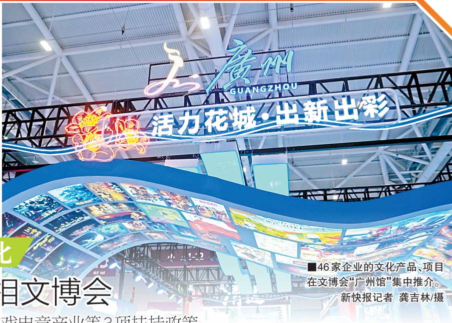
46家企业的文化产品、项目在文博会“广州馆”集中推介。