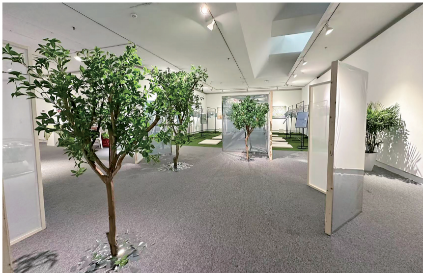
■策划组特别制作了装置作品“洞”