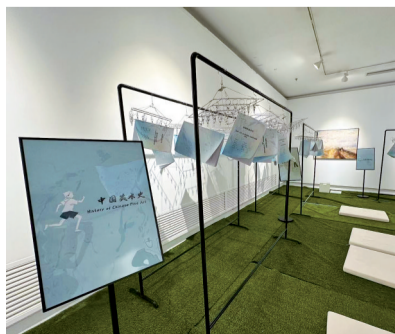
■用晾衣架挂起来的论文

可以理解为,他们用理论诠释历史或社会中的艺术问题,又用艺术的手段把理论逻辑进行视觉化,再把二者结合形成一个对地域性的集体“记忆”——回南天的视觉艺术的表达。