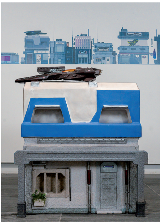
■林旭红《时空叠印·上下九》