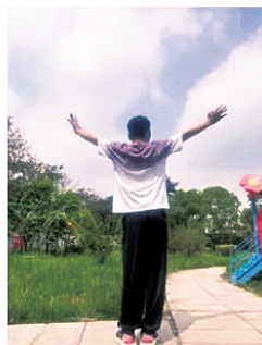
如今能独立站立行走