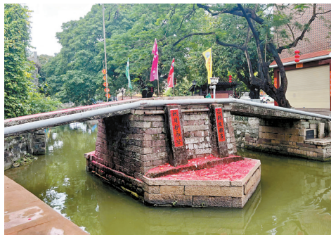
■龙眼古桥,最初为竹木桥,宋时砌石墩铺板,明景泰三年顺德建县,古桥通道成县道,清代一度成为“龙眼八景”之一的“古桥秋月”。

3000多年前彼时还是“龙渚”的龙眼村,环三座山岗而建,即今天在地图上看到的圆岗山、石岗山和永安岗山,那一块块“渚”随水涨潮落而成滩涂湿地,先民以捕鱼为生。其后男耕女织,桑基鱼塘,不断发展,直到南宋咸淳九年(公元1273年),梁姓族人南迁至此,与黄、吕、周、陆、余、李、麦等姓氏共融共生,共同兴建村庄。