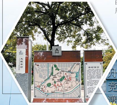
▲龙眼村漫步示意图。

“点睛”结束,主客双方还要互赠礼物,然后“龙”不能原路回去,需由专人指引顺时针绕太尉庙一周,称为“行大运”。