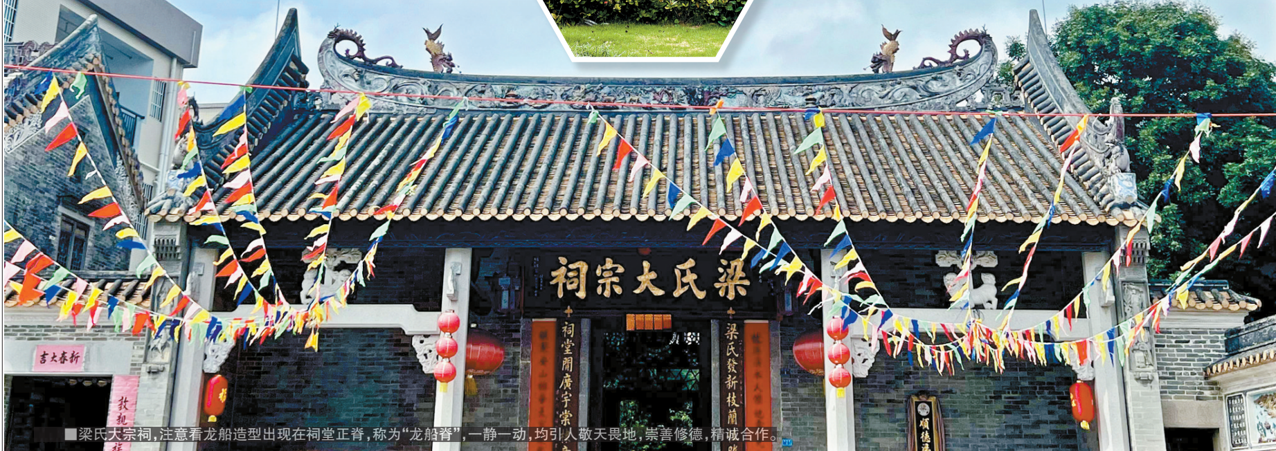
■梁氏大宗祠,注意看龙船造型出现在祠堂正脊,称为“龙船脊”,一静一动,均引人敬畏地,崇善修德,精诚合作。