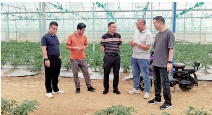
■驻下太镇工作队调研，帮农户破解辣椒滞销难题。

座谈会后，佛山市驻肇庆市德庆县工作组一行还实地考察了东陂镇的部分乡村振兴项目，并对驻东陂镇工作队的工作给予了高度评价。双方表示，将以此次交流为契机，加强沟通联系，深化合作，共同推动两地乡村全面振兴工作取得更大成效。