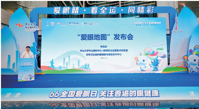
■爱眼地图发布现场。

测绘与街景影像分析，综合绿视率、可视距离等环境参数，首次为城市每条街道生成实时更新的护眼指数。”