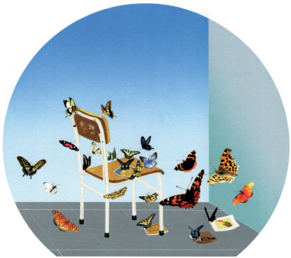
■谢应云《浅夏》网版 2020年