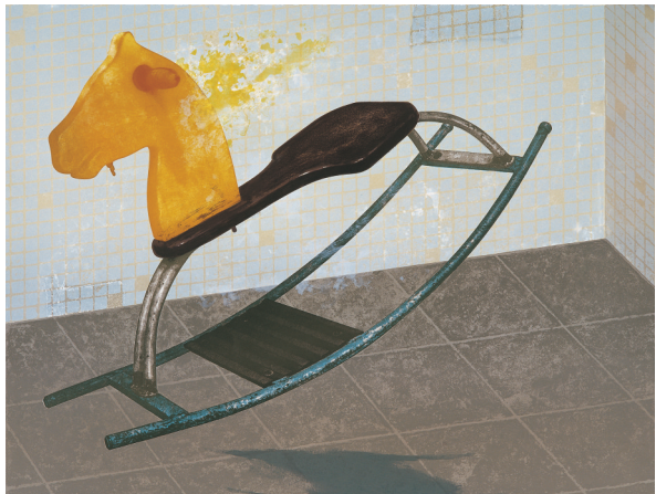
■谢应云《温暖的记忆》2011年