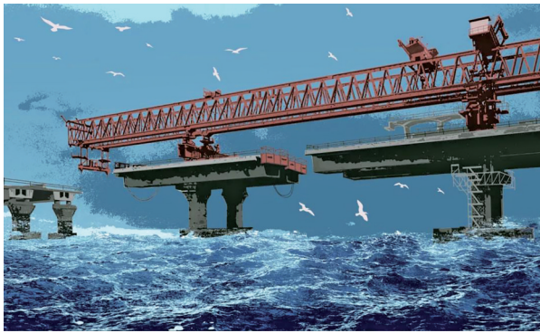
■陈华辉《壮阔波澜》丝网版画 2021年