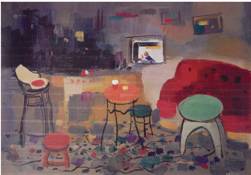
■吴冠中《英国乡村酒店》版画