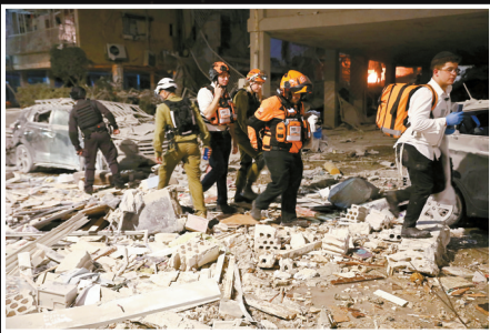
■6月15日,在以色列特拉维夫南部巴特亚姆地区,应急人员在导弹袭击现场开展工作。