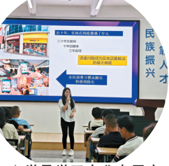
▲学员学习农业电子商务知识。