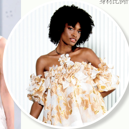
◀无肩带设计的裙摆式上衣大胆展露肩部和锁骨线条,搭一条华丽项链就能成全场焦点。