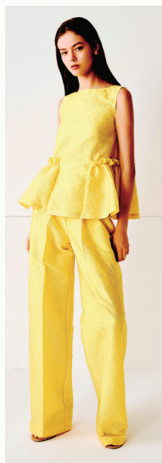
◀线条利落的休闲裤搭裙摆式上衣,享受舒适的同时展露优雅气质。

此外在选择裙摆与袖子时也需注意,尽量选褶皱较为宽松、垂感好的裙摆,有效遮肉的同时展露优雅。袖子不要选过于夸张的款式,好比超级大的泡泡袖,虽然看起来很个性,但容易显得肩宽,特别是小个子女生穿上会像“小企鹅”失去原本的时尚感。三分袖或简约袖型更合适,既能展现女性柔美,又不至于张扬。