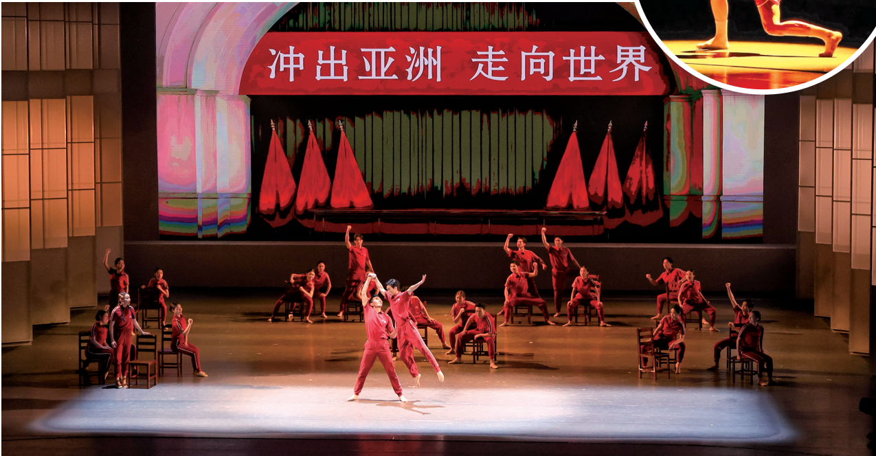
■6月27日至29日,由广州体育学院师生团队匠心巨献的原创当代舞剧《人生能有几回搏》在广州市文化馆公演。

在广东省二沙体育训练中心,“人生能有几回搏”这几个大字就写在门口,这是广东体育军团的精神写照,更是一代又一代南粤健儿的拼搏基因。再过133天,十五运会就将在羊城正式拉开大幕。继第六届和第九届之后,南粤健儿再次主场作战,在容国团拼搏精神的激励下,他们将向更高的山峰攀登。