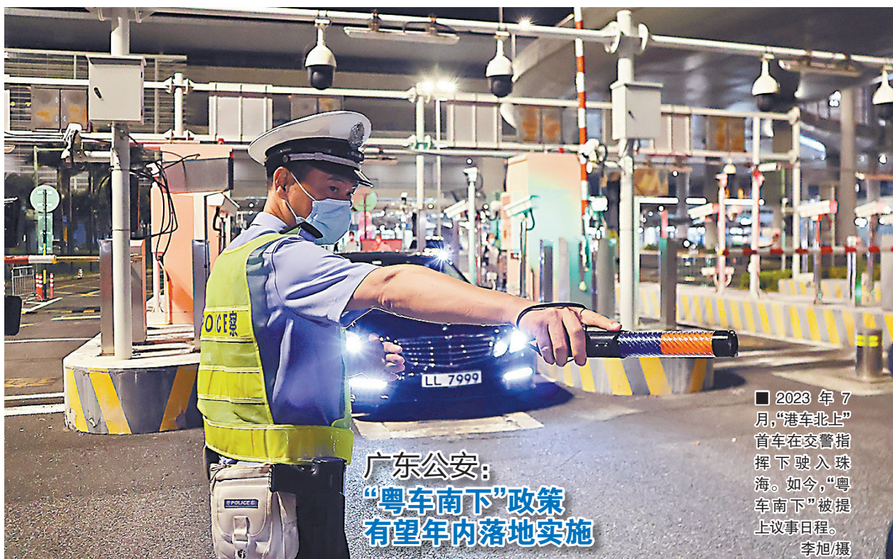
广东公安: “粤车南下”政策 有望年内落地实施

意见稿称,本办法有效期为3年,由公积金中心负责解释和修订。征求意见稿时间至7月11日。