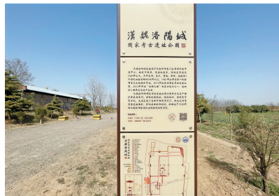
■汉魏洛阳故城遗址。

1962年汉魏洛阳故城遗址开始进行全面考古发掘,出土了2万 multiple件(套)文物,是目前考古资料最丰富的都城遗址;依据故城遗址所建的博物馆设“中”“合”“同”三大主题展厅和一间精品厅,展出1300多件(套)珍贵文物,其中包括东汉昭君出塞铜镜、西晋荀岳墓志、曹魏石椁、北魏石刻子母阙围屏石棺床、北魏拜占庭金币、北魏永宁寺佛像等汉魏时期的文物精品。