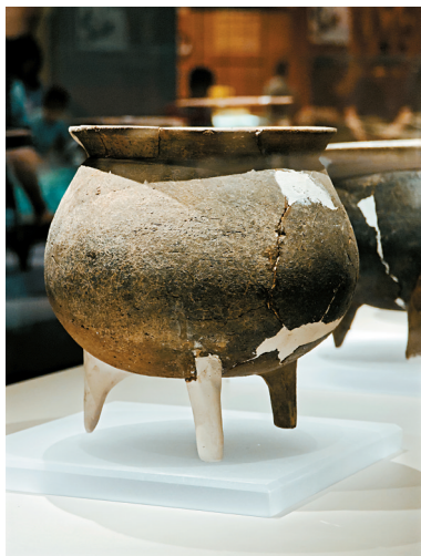
■彩陶文化是仰韶文化最亮眼的一脉。

彩陶文化是仰韶文化最亮眼的一脉,大河村遗址最典型、最有特色的出土文物也数彩陶,数量繁多,形态各异,图案和色彩都令人惊叹,震惊世