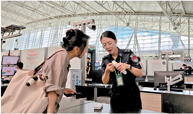
■白云机场安检人员为旅客讲解充电宝携带须知。

白云机场提醒广大旅客在出行前仔细核对自家的充电宝认证标识、品牌及型号等信息,不要因携带不合格充电宝而给出行带来不便。另外,旅