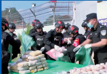
■中国警方查获毒品。