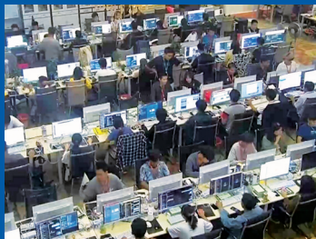
■白家电诈园区内部。