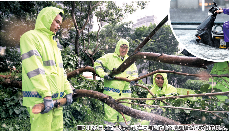
7月20日,工作人员冒雨在深圳红岭北路清理被台风吹倒的树木。

各地市闻“风”而动、争分夺秒,突出抓好“人”的安全,滚动排查船回港、人上岸等措施落实情况,坚决彻底转移海岛、地质灾害隐患点、城市低洼地带等危险区域人员,切实做到应转尽转、应转早转、应转快转。