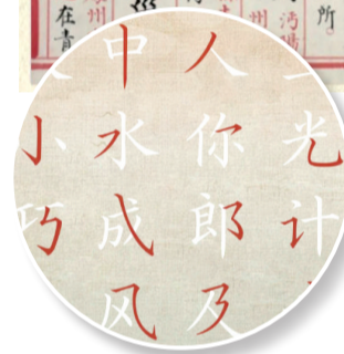
▲方正文沁永乐大典体定型的32种基本笔画。