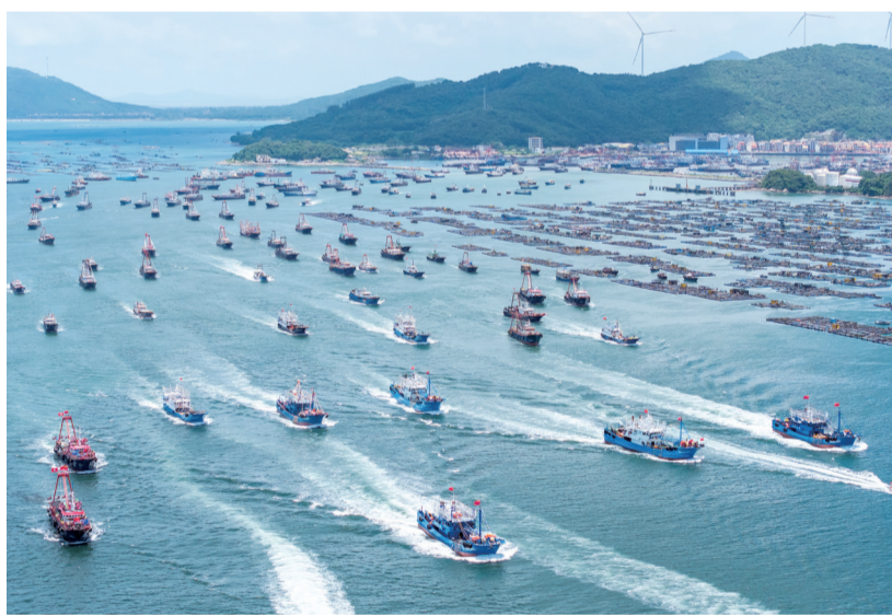
■随着开渔令发出,停泊在阳江闸坡渔港内的众多渔船争“鲜”出海。

12时许,随着开渔令的发布,阳江3400余艘渔船与全省渔船一同扬帆出海,标志着为期3个半月的南海伏季休渔圆满结束,新一轮耕海征程正式开启。海面上千帆竞发,渔港内外热闹非凡。据主办方透露,今年开渔季出征渔船,是历届最多的一次,为游客提供了极具冲击力的观光体验。