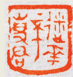
■作者(连博) 迷花不事君