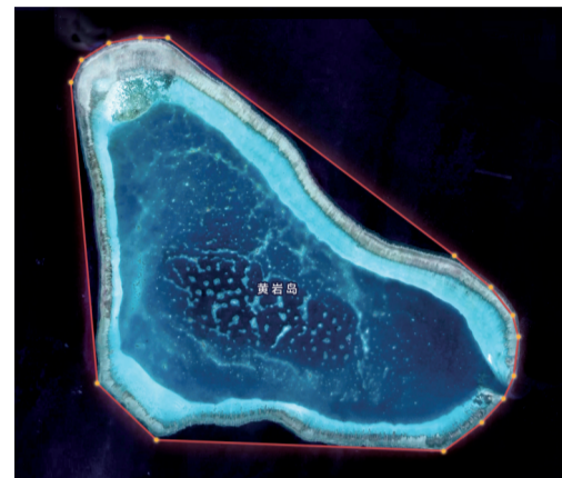
■2024年11月10日我国公布黄岩岛领海基线。