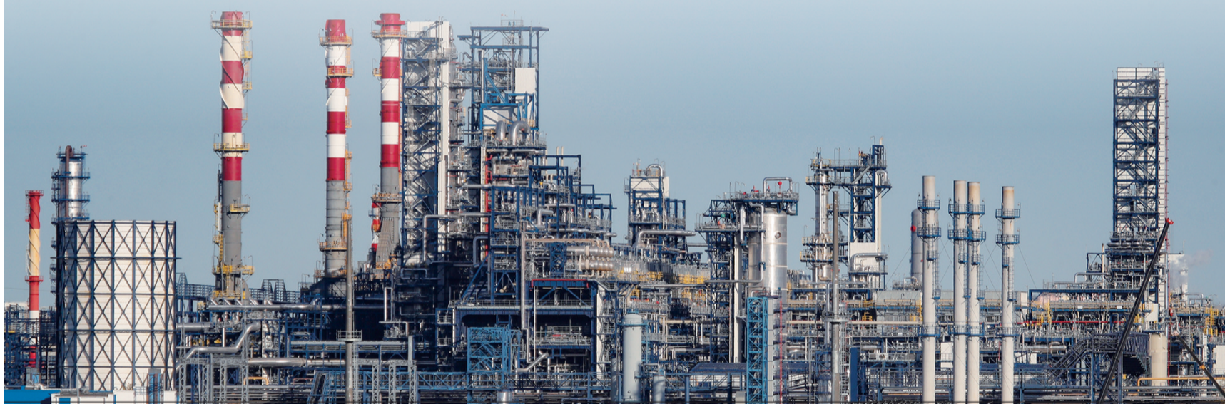
■图为在莫斯科拍摄的俄罗斯天然气工业石油公司的炼油厂资料照片。

23日,欧盟方面说,欧盟成员国已批准第19轮对俄制裁,此轮制裁包括新增69项单独制裁和多项经济限制措施,主要针对俄能源、金融和军工领域。