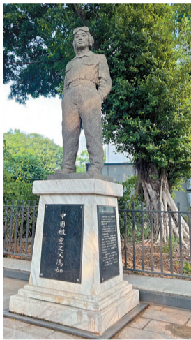
■“中国航空之父”冯如像。