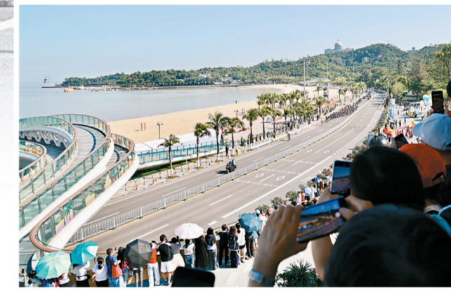
■选手骑行经过珠海城市阳台。