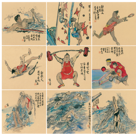
《巴黎奥运组画》李夏夏 2025年

2019年9月16日，范扬因其以大量精湛作品推动体育与艺术融合，从而将体育的瞬间升华为永恒的艺术，经国际奥委会执委会严格遴选，由托马斯·巴赫授予范扬“顾拜旦奖章”，这枚设立于1964年的奖章，旨在表彰为奥林匹克事业作出卓越贡献的人士。