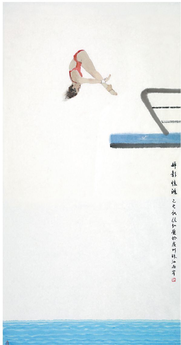
■《翩影惊鸿》中国画 2025年 张弘