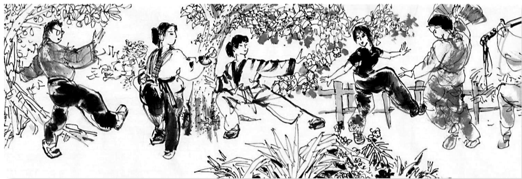
■《新活力广州速写卷》局部