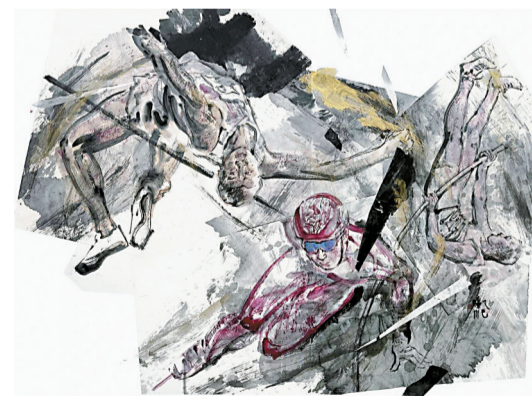
■《舞》 陈川 2025年

2022年，张弘去了一次滑雪场体验了一把滑雪，亲身体会了穿滑雪服的讲究，穿滑雪板的严谨以及原理等，让他一下子懂了滑雪运动员的各种动态。所以，当冬奥会的滑雪竞技开始之后，他选了好几个动作进行创作，实际上，自由滑雪项目，运动员在空中转了好几圈，几乎是每一面都能看到，这时候就取决于画家选取哪一个瞬间进行定格，而那一刹那所反映的也正是画家独特的眼光与对动态审美的高度。“因此，画运动题材，关键的不在于快，而在于捕捉的角度。”