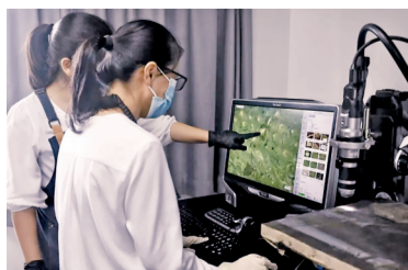
运用超景深显微镜对颜料层检测分析。