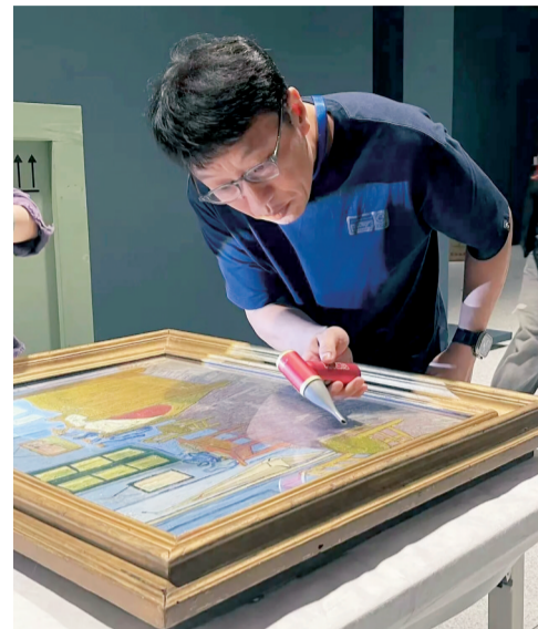
国际艺术机构藏品保护项目工作现场。

2025年11月13日,“文化遗产保护与管理国际学术论坛”在广州美术学院大学城校区举行。来自中、英、法、德等多个国家的研究学者齐聚一堂,围绕文化遗产保护的教育体系、技术应用、实践案例等议题展开深度探讨。