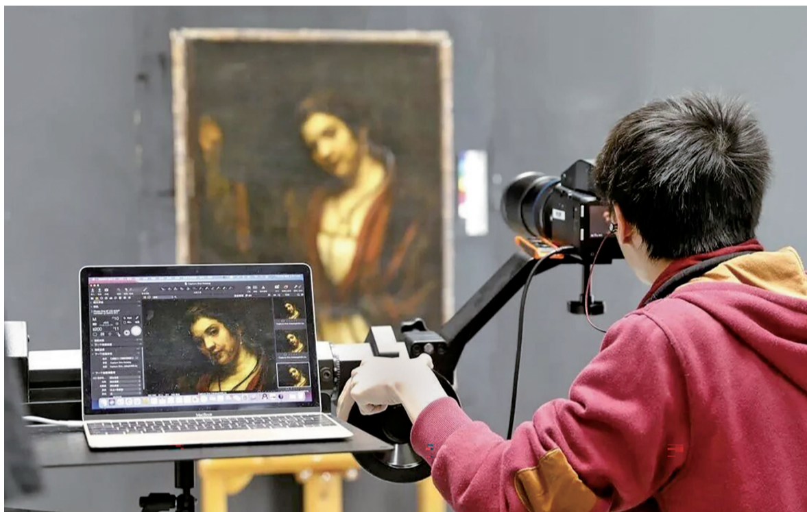
科学图像采集实验室。

因此,无论是瓦莱丽·李观察到的东西方教育差异,还是安德里亚·纳内蒂提醒的科技与人文平衡,都指向一个核心命题:如何在坚守遗产原真性的基础上,实现保护理念、方法与机制的现代化转型?如何让文化遗产保护真正走进大众生活,成为全社会的自觉行动?都是一系列的新课题。