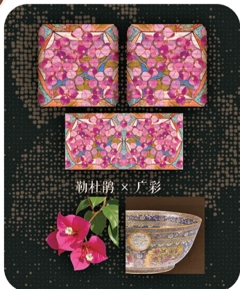
■《湾区四时·花灯戏韵》中不同花卉图式与非遗技艺以及灯笼的融合。