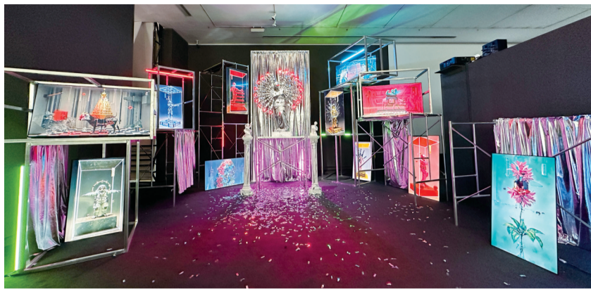
■“湾区·艺术与科技三年展”现场。

主办方介绍,大湾区是一片处于不断生成的地理与精神地带。这里的水从未静止:潮汐、贸易、信仰、资本与算法在流动的密度中交叠,构成一种尚未被命