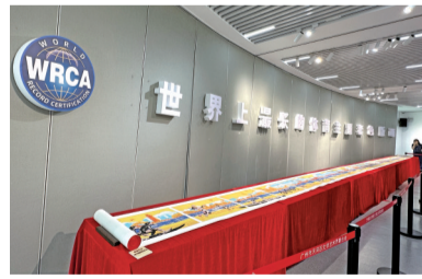
■“世界上最长的体育主题套色版画”展出现场。

成——每一块版画的尺寸校准、色彩衔接都经过反复调试,最终汇聚成浑然一体的视觉盛宴。工艺上采用13色多版套印技术,累计版数高达近4500版:每一层颜色的位置偏差需控制在毫米级,每一次套印的油墨深浅都要反复试印,近4500次的精准操作,既是对团队专业能力的极致考验,更是对“非遗匠心”的传承与致敬。