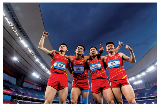
■12月14日,残特奥会田径项目比赛北京队队员在男子4x400米接力听障比赛获得冠军后激动落泪。