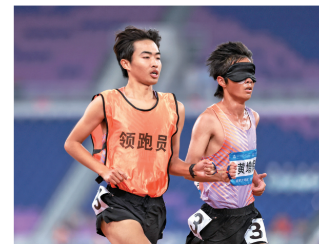
■12月12日,残特奥会田径项目男子10000米T13级比赛进行中。