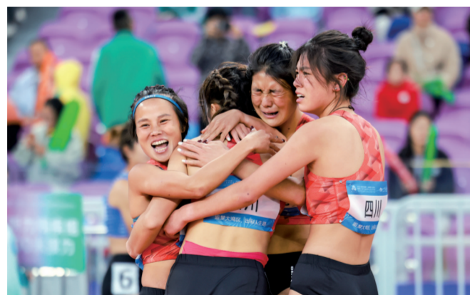
■12月14日,残特奥会田径项目女子4x400米接力听障决赛比赛结束,四川队队员紧紧相拥。