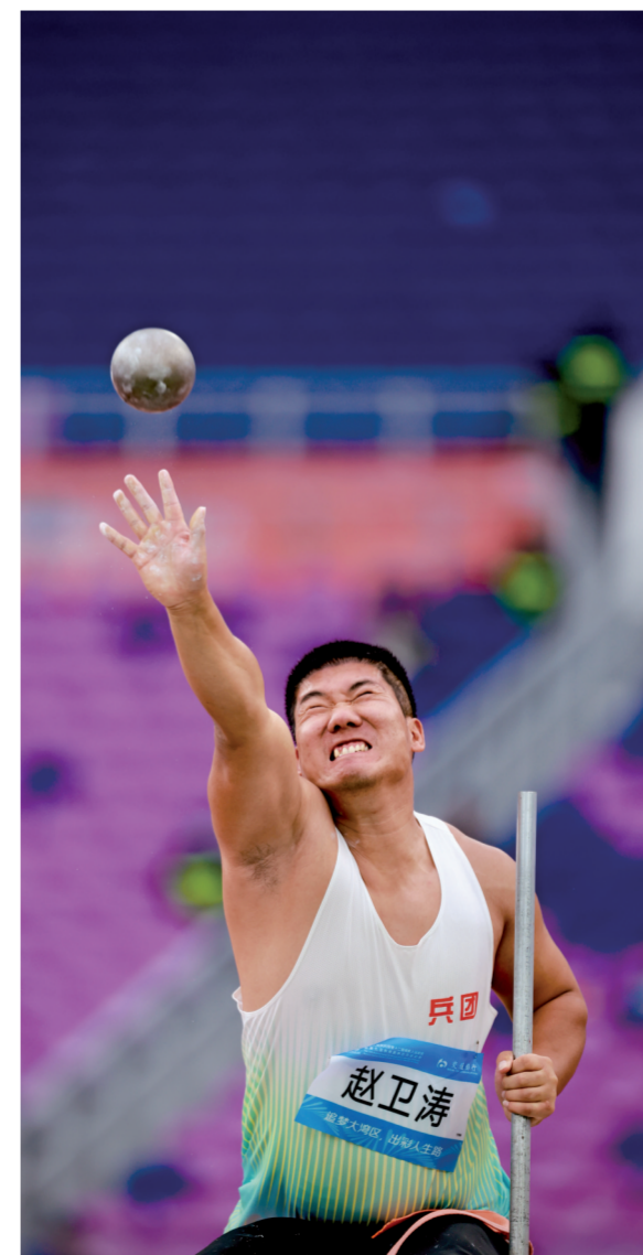
■12月10日,男子铅球比赛中。