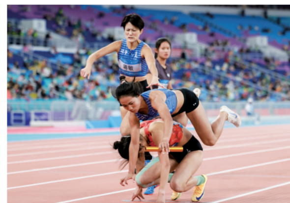
■12月14日,残特奥会田径项目比赛选手在女子4x400米接力听障比赛中出现失误。