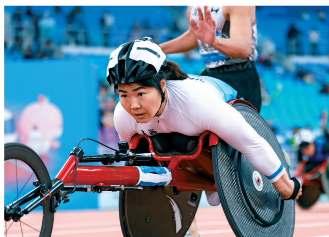
■12月14日,残特奥会田径项目比赛选手在4x100米混合接力比赛中,轮椅运动员与非轮椅运动员的交接采用“接触式”。