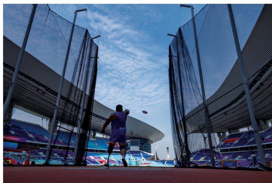
■12月12日上午,残特奥会男子铁饼F64级决赛进行中。