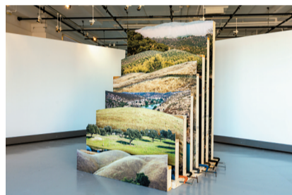
■戴思乐,《蒙特多A》,选自《查帕拉尔上的盛夏》,摄影装置,木材、喷墨打印件、紧固件、夹具,253 cm × 163 cm × 163cm,2020,作品由艺术家提供