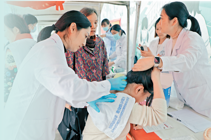
■“荔医先锋”健康集市吸引不少市民参与。新快报记者 毕志毅/摄(资料照片)