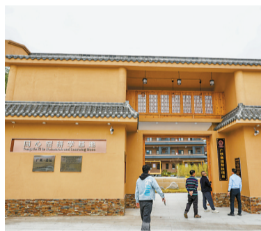
■龙颈镇同心窑研学基地。

“尝尝鸡心黄皮”“红糖陈醋姜也不错”……近日，来自广铁集团广州房建公寓段的干部职工走进龙颈镇美丽圩镇客厅，近距离感受龙颈镇的悠久历史与文化遗产，品尝购买当地农特