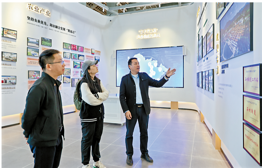
■广铁集团广州房建公寓段干部职工参观龙颈镇美丽圩镇客厅。