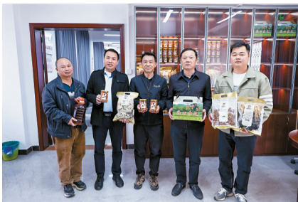
■驻龙颈镇工作队队员与龙北村干部推介农特产品。