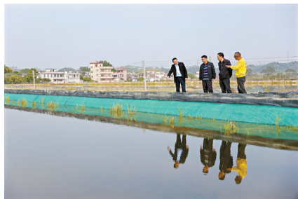
■龙北村“虾稻共生”项目。