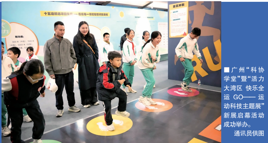
■广州“科协学堂”暨“活力大湾区 快乐全运GO——运动科技主题展”新展启幕活动成功举办。通讯员供图

新快报讯 记者陈慕媛报道 普及科学健身知识，激发全民运动热情。12月26日下午，由广州市科学技术协会、共青团广州市委员会联合主办，广州市科学技术发展中心、广州市少年宫、广州湾区少年科学院共同承办的广州“科协学堂”暨“活力大湾区 快乐全运GO——运动科技主题展”新展启幕活动在广州青少年科技馆成功举办。