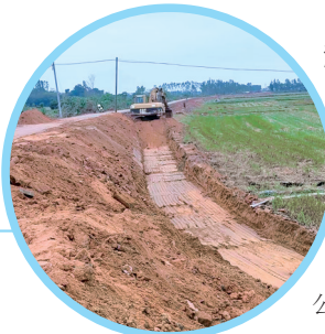
▲建设中的杨家乡村道。

全长1.8公里的道路通车,不仅惠及沿线80多个自然村的村民,更为雷州“三家一水”(杨家乡、唐家镇、纪家镇、企水镇)20余万群众出行提供了交通便利。