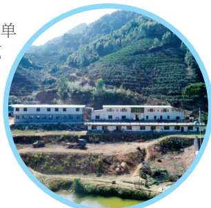
▲2021年的梅州市大埔县鸟子石茶叶种植基地。

富岭村分别建立大米、单丛、黄豆三个种植示范基地。2025年春季,上漳村鸟子石茶山富硒单丛种植示范基地的单丛蜜兰香达到富硒茶标准,光德镇种出了名副其实的“富硒茶”。