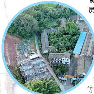
▲闲置资产老旧畚江粮所旧貌。

工作队还联动农业基地和产业园建设,开展参观研学等活动,已吸引超过5000人次的游客和学生等人员前来参观体验,带动周边相关产业增收约50万元。