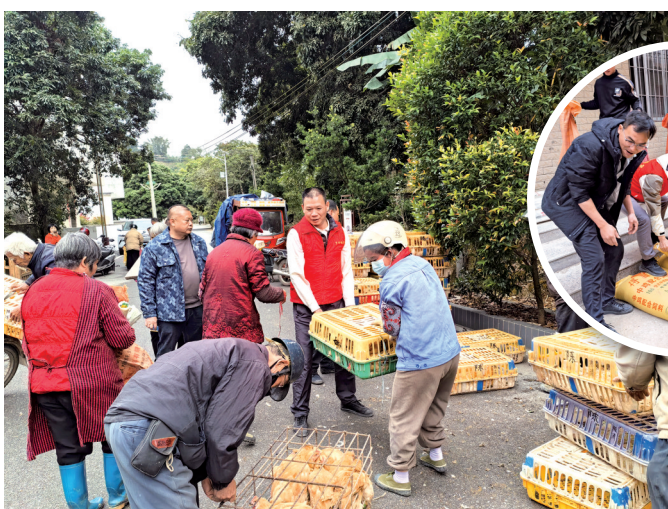
■鸡苗发放活动现场。

新快报讯 记者方轶 通讯员陈肖儒报道 为持续巩固拓展脱贫攻坚成果,扎实推进防返贫监测帮扶工作,近日,驻替滨镇帮扶工作队积极联动镇政府及村“两委”,在村委活动场地组织开展鸡苗发放活动,为脱贫监测户发展庭院养殖、促进产业增收提供有力支持,激发群众内生动力。