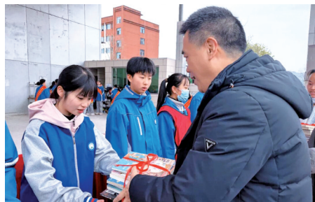
■精心挑选的书籍被交到学生代表手中。