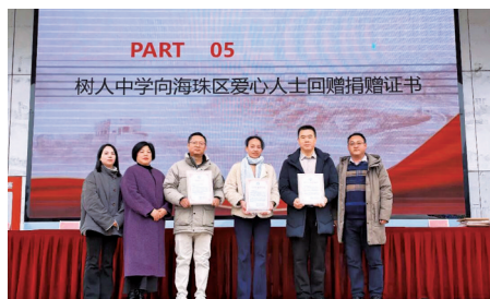
■树人中学向爱心人士回赠捐赠证书。