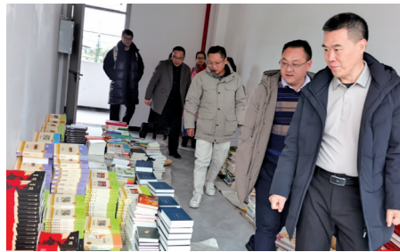
■本次捐赠的4030册图书涵盖多个类别,均为适合中学生阅读的精品图书。

从珠江河畔到贵定校园,这场跨越千里的赠书活动,不仅丰富了树人中学的藏书,更在学生们心中播下了阅读的种子、感恩的种子。