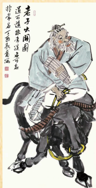
■刘斯奋《老子出关图》

进步、与时代一起前进的人,而不是做一个旁观者、牢骚者乃至逆历史潮流而动的人。近代以来,广东人民一直站在推动历史前进的第一线。改革开放以来广东人民的贡献举世瞩目。刘斯奋的学术与文艺成就,是新中国文化在广东繁荣发展的一个代表。在他身上,集中凝聚和反映了当代岭南文化的新成就。