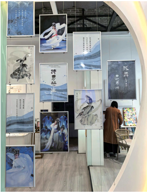
■“跨界共生”板块将水墨画作与粤剧戏服、乐器等元素巧妙并置。