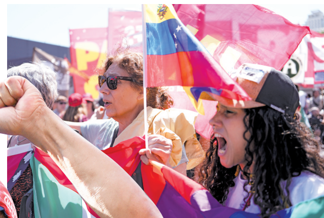
■1月3日,阿根廷民众在位于首都布宜诺斯艾利斯的美联储阿根廷大使馆附近抗议。