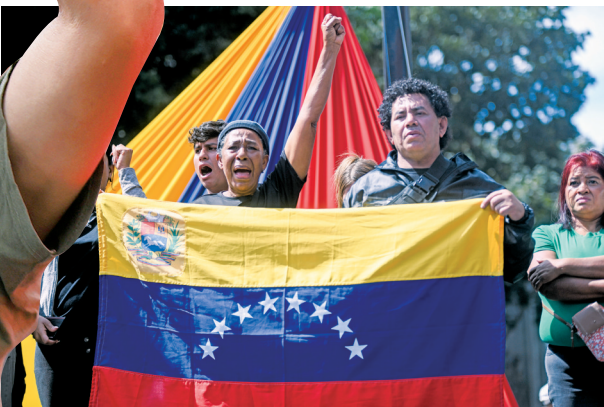
■1月3日,在委内瑞拉首都加拉加斯,民众在米拉弗洛雷斯宫附近集会。