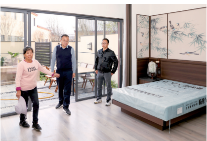
秀水村状元及第民宿。