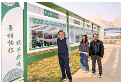
富川现代设施蔬菜产业园。