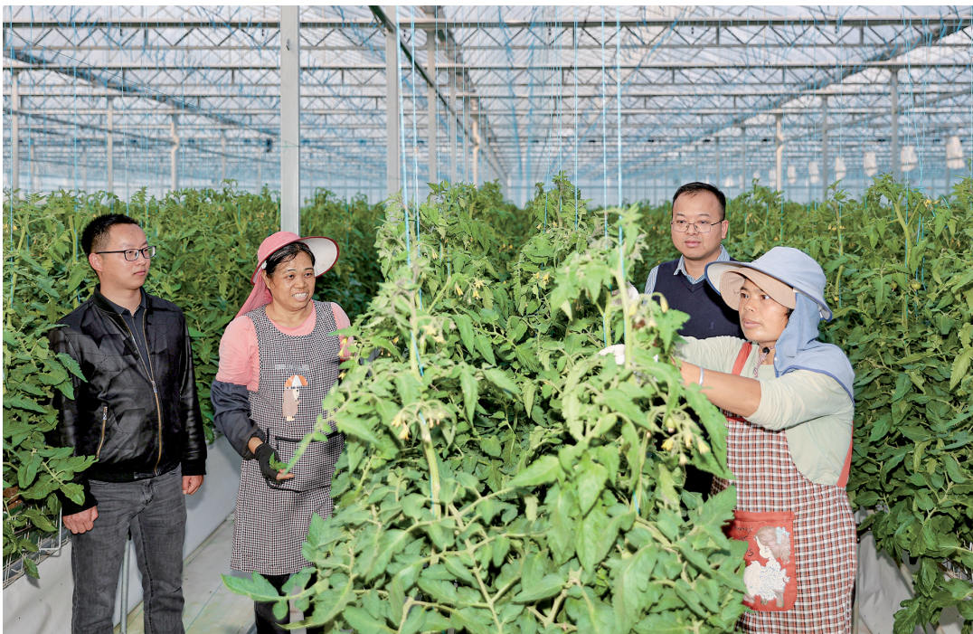
富川现代设施蔬菜产业园,村民在蔬菜大棚里照料西红柿。