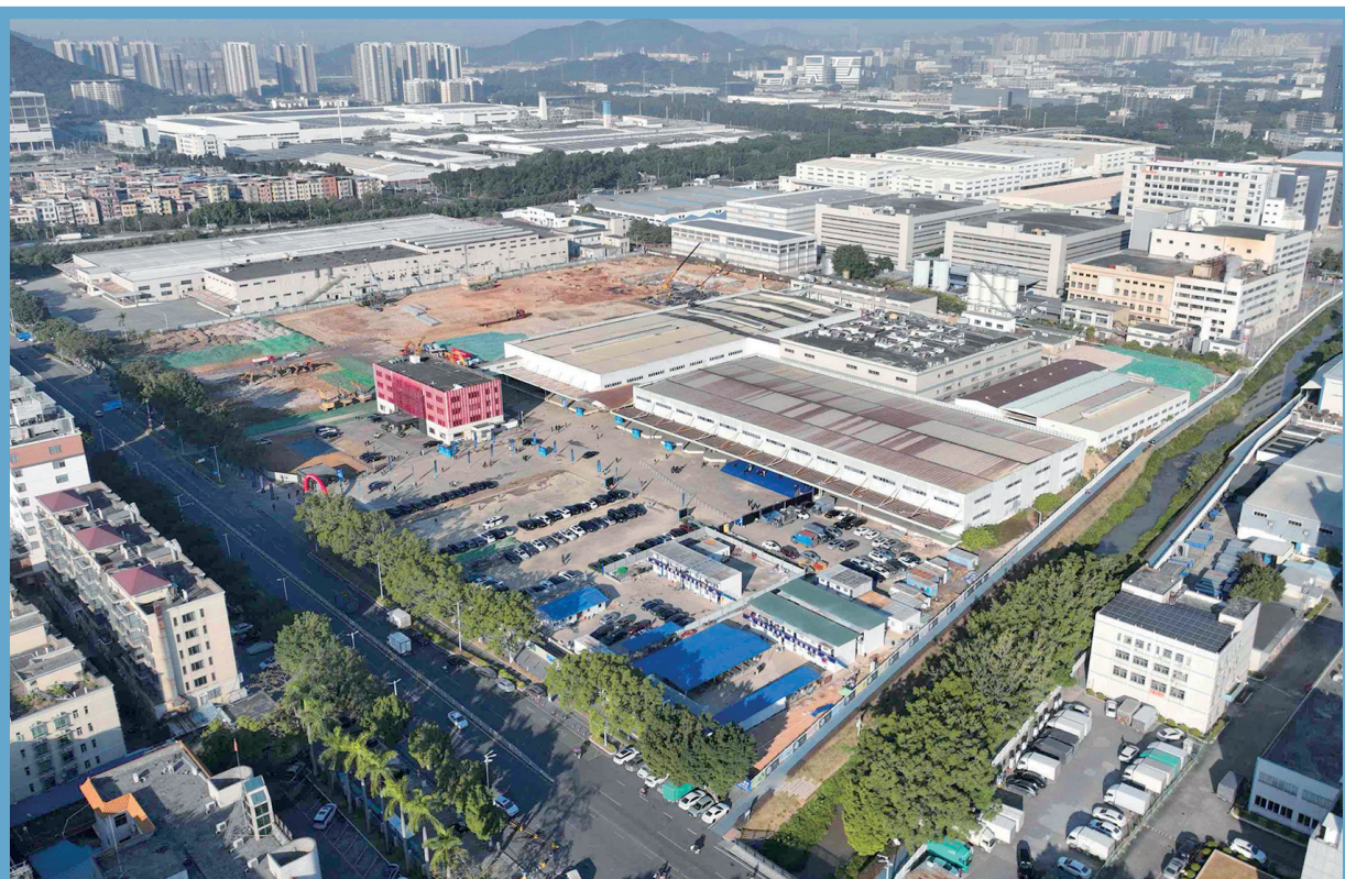
■合煜科技园地块现状,未来将重点布局人工智能、生物技术、高端装备等战略性新兴产业。