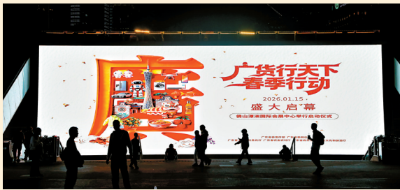
■1月14日晚,广州塔和花城广场大屏幕为“广货行天下”春季行动亮灯。