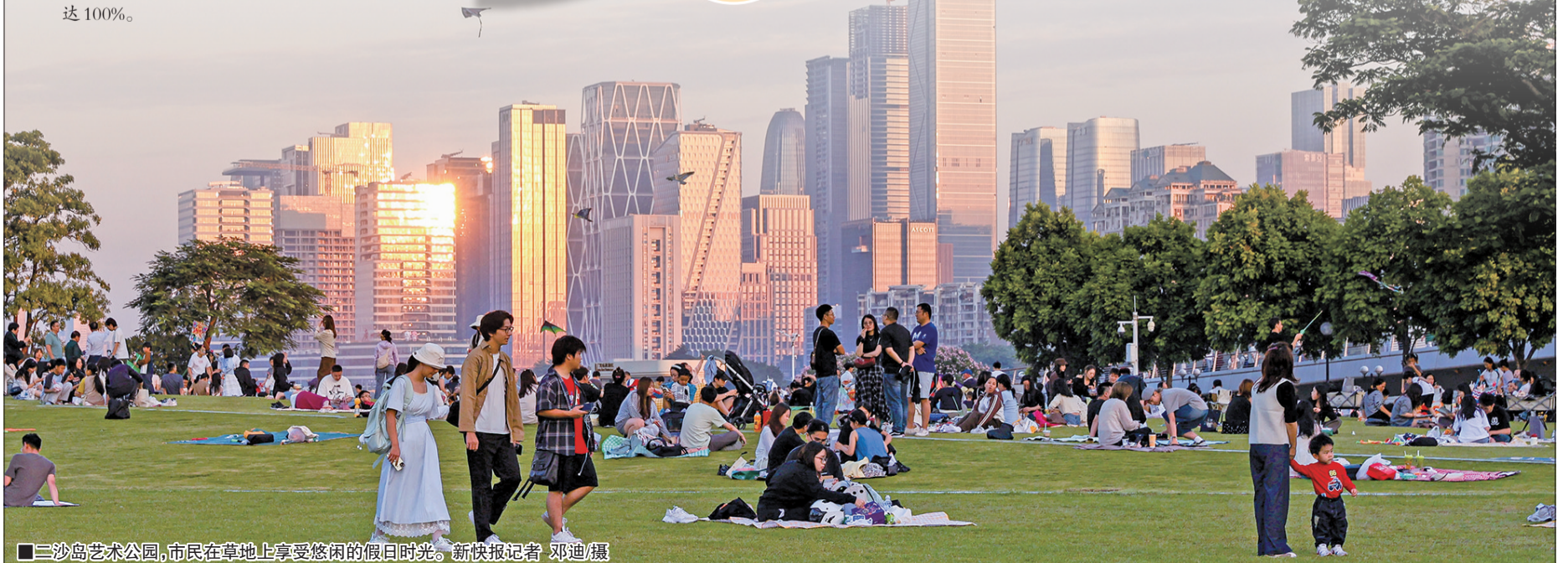
■三沙岛艺术公园,市民在草地上享受悠闲的假日时光。