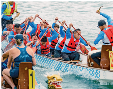
■中外龙舟同台竞技。