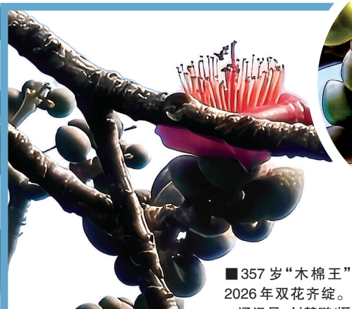
■357岁“木棉王” 2026年双花齐绽。

南站地区春运工作领导小组在詹天佑广场组织开展2026年春运应急综合演练,多部门联动应对大客流与突发事件,全面提升春运期间应对各类突发事件的能力,保障旅客平安有序出行。演练覆盖站区秩序维护、治安应急处突、大客流疏运、突发火情应急救援等关键场景,突出多部门协同与实战响应。