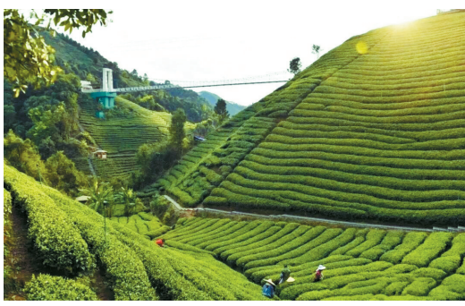
■至2025年底,昭平县已有1.33万亩茶园获得有机认证。

据悉,该示范基地将聚焦良种培育、技术推广、人才培训和品牌打造等关键环节,开展农业技术实操指导和培训,培育懂技术、会经营、善管理的新型农业人才,持续健全联农带农利益联结机制,推动农业科技创新成果在基层落地生根。