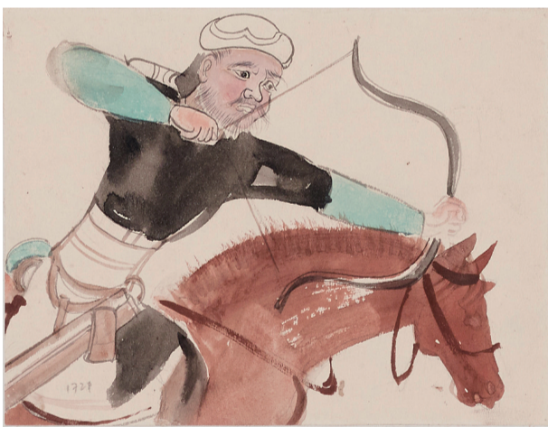
■刘济荣临 敦煌莫高窟 作品