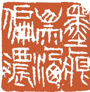
■墨痕山雨洒偏浓 梁晓庄

清代以后的诗人,也有不少吟咏景物人文的诗歌,所作意境幽深,清新优美。如梁佩兰的“明河无影月临空”、黎简的“细雨人归芳草晚,东风牛藉落花眠”、冯敏昌的“深篁寒雨梦梨花”、黄丹书的“与竹相知新”、谢兰生的“墨痕山雨洒偏浓”、谭敬的“水头潮长卖花去”、黄培芳的“江流碧玉山如黛”、张维屏的“造物无言却有情”、徐荣的“东海屠长鲸”、陈澧的“人有幽怀爱深夜”等,这些诗句抒怀叙事,超妙自然。我在篆刻中多用中山王铭文、汉碑额、汉金文入印,取刚健、婉转、典雅的文字布局,以体现诗句情致深美的空灵之