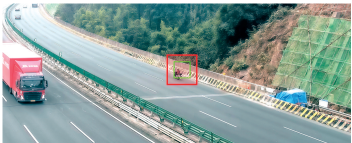
■“AI监控员”监测到路面有异常事件。