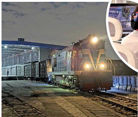
▲工作人员在云舱内监测站场车流情况。